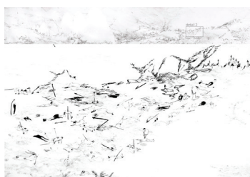
Détail Rada Tzankova

Cloître Ouvert 222 rue du Faubourg Saint-Honoré 75008 Paris Du lundi au dimanche / 8h30 - 20h00 et sur rendez-vous +33 7 68 43 99 79 Fb : @laDGalerie / insta : @d_galerie contact@dgalerie.com