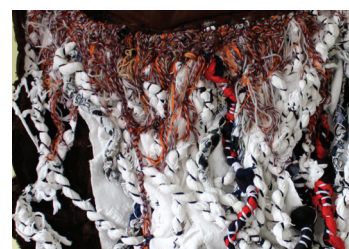
Détail Hyacinthe Ouattara